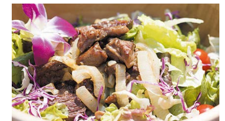
ソテードビーフ&淡路玉ねぎオーシャンサラダ