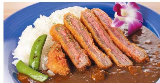
オーシャン淡路牛 ビーフカツカレー