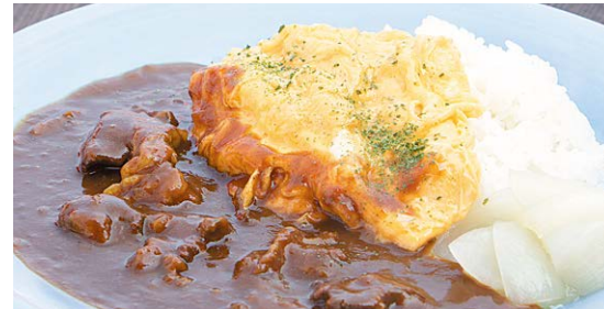
淡路島の卵カレー