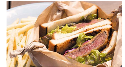
オーシャン淡路牛 ビーフカツサンド