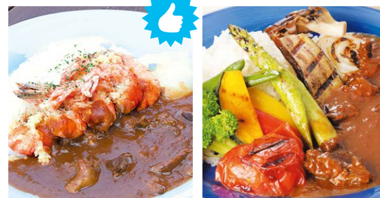
ガーリックシュリンプカレー