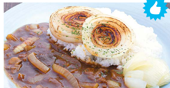
淡路玉ねぎカレー