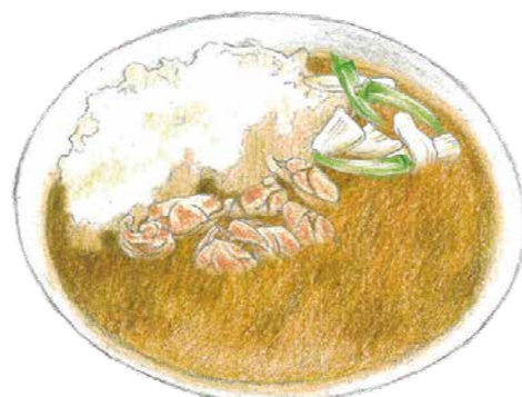
農援隊グリーンカレー ¥1,580

エビの濃厚で深みのある旨味がふんだんに溶け込んだ、芳醇で贅沢感あふれるカレーです。