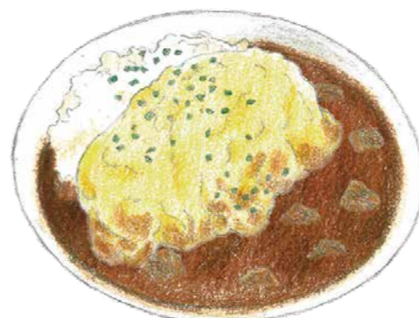
淡路島たまごのオムカレー ¥1,780

淡路島産の鶏肉を使用し、ココナツミルクとスパイスが香り高いエスニック調のカレーです。