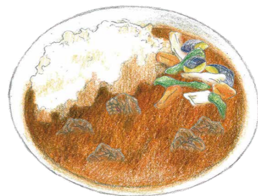
淡路牛はちみつカレー ¥1,680

HAL YAMASHITAが「Ocean Terrace」のオリジナルレシピとして生み出したカレーです。