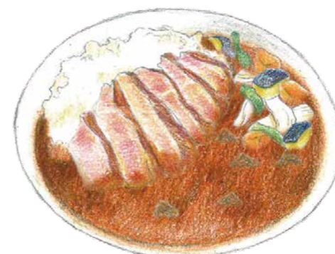
淡路牛ステーキカレー ¥2,980

少し辛めのオーシャンテラスカレーをベースに、淡路島産のたまごをふんわりのせてほんのりマイルドに。