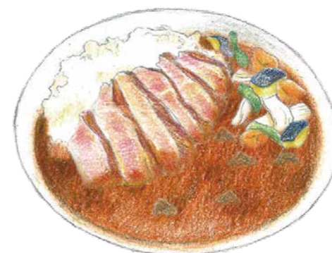
淡路牛ステーキカレー ¥2,980

少し辛めのオーシャンテラスカレーをベースに、国産のたまごをふんわりのせてほんのりマイルドに。