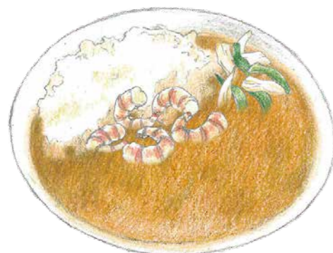
農援隊ビスクカレー ¥2,580